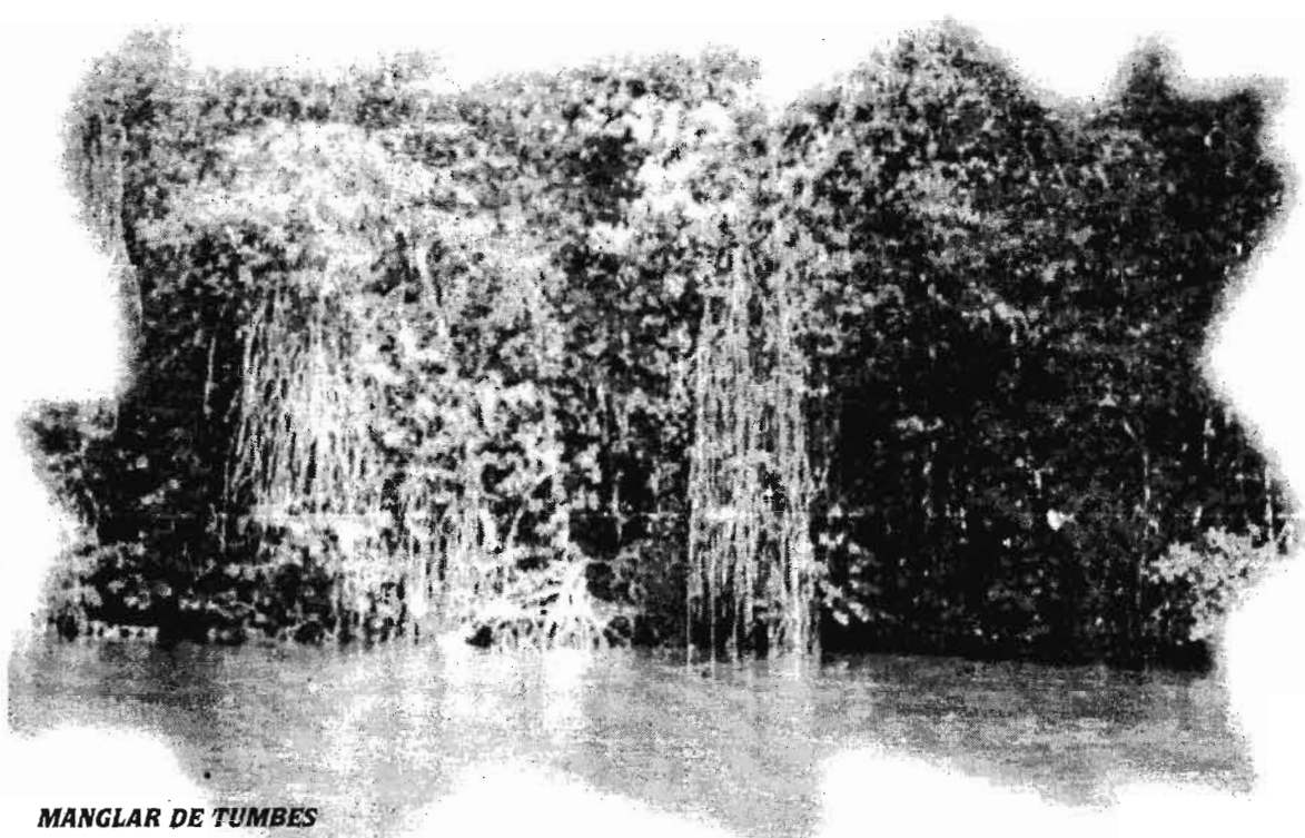
MANGLAR DE TUMBES

Este momento es histórico por hombros para desafiar las alturas y la razón.