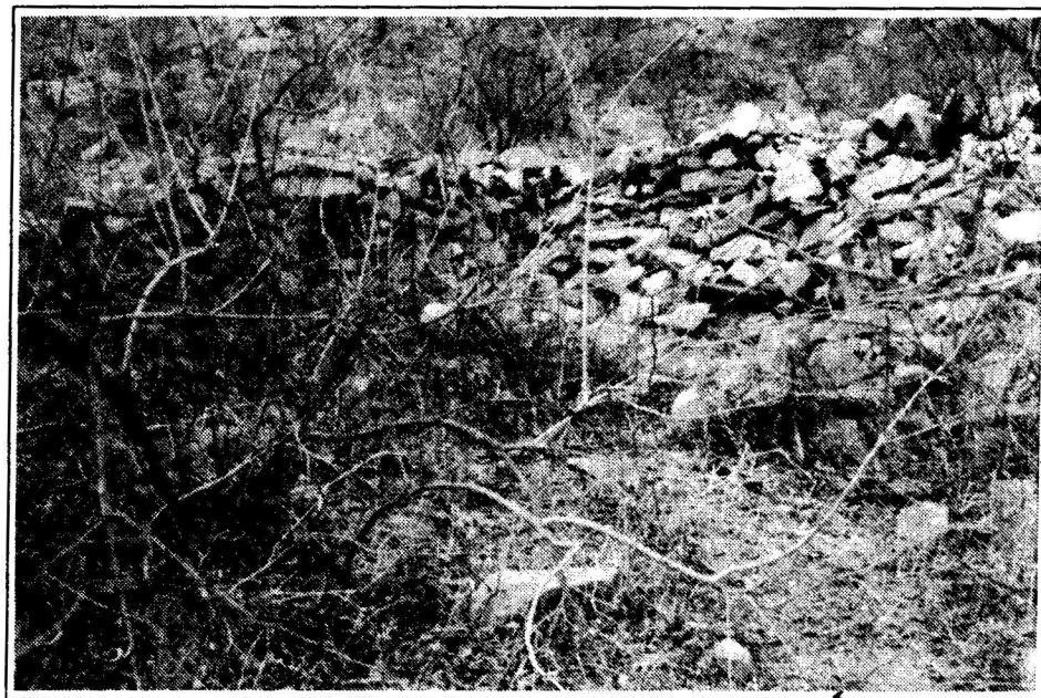
Restos de lo que sería la fortaleza del cacique de Serrán.